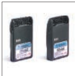
MDJMNN4023/MDJMNN4024 Akumulator Lilon o pojemności 1000 mAh / Akumulator Lilon o pojemności 1320 mAh