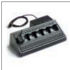
MDHTN3004/MDHTN3005 Ładowarka wielostanowiskowa Z wtyczką europejską / z wtyczką brytyjską