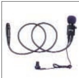
MDJMMN4062 Zestaw kamuflowany