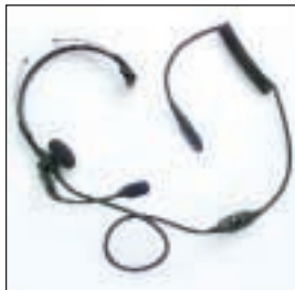
MDJMMN4066 Lekki zestaw nagłowny z mikrofonem na wysięgniku i przyciskiem PTT na przewodzie

Tylko oryginalne akcesoria i akumulatory firmy Motorola są gwarancją solidności, niezawodności i jakości.