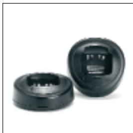
MDHTN3001/MDHTN3002 Ładowarka jednostanowiskowa Z wtyczką europejską / z wtyczką brytyjską