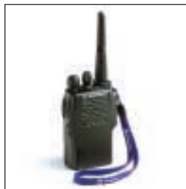
JMZN4020 Pasek do noszenia w dłoni