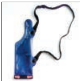
HLN9985 Futerał wodoszczelny