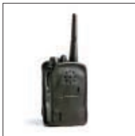
PMLN4521/PMLN4421 Lekki futerał skórzany z obrotowym zaczepem do paska